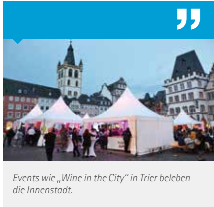
Events wie „Wine in the City“ in Trier beleben die Innenstadt.

Um den Konsumenten die besondere Qualität innerstädtischer Einzelhandelslagen näherzubringen und deren Entwicklung positiv voranzutreiben, bedarf es einer Kooperation aller relevanten Akteure. Folgerichtig haben sich in der Vergangenheit Interessengemeinschaften bzw. Standortgemeinschaften, in denen Händler, Kommunen, Wirtschaftsorganisationen, Kammern, Immobilienbesitzer, Gastronomen und engagierte Bürger organisiert sind, gebildet. Ziel dieser, überwiegend als eingetragener Verein operierenden Stadt- oder Citymarketinginitiativen ist das gemeinsame Erkennen sowie die Mobilisierung der spezifischen Potenziale einer Stadt. Dabei gilt es den öffentlichen Raum durch gemeinschaftliche Aktionen und Projekte öffentlichkeitswirksam zu beleben und zu vermarkten, um im Endeffekt die Attraktivität unserer Innenstädte zu steigern, wovon letztendlich alle Mitglieder der Standortgemeinschaften profitieren.